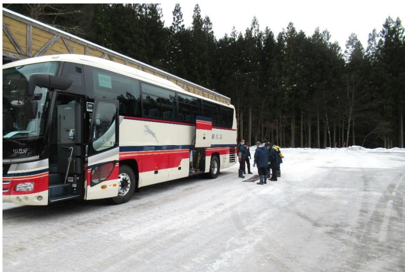
雪道走行及びチェーン着脱研修