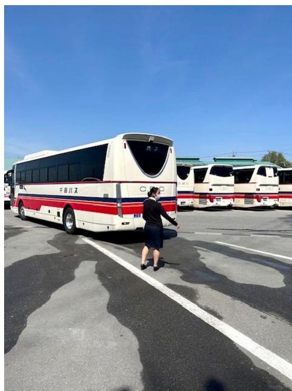
観光バスガイド バック誘導研修